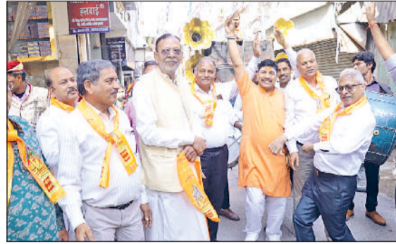
सोनीपत। हलवाई हट्टा में निकाली श्रीराम बारात के दौरान बैंड-बाजों की धुन पर झूमते श्रीदेवी चिट्टाने वाली माता मंदिर सिद्धपीठ समिति के पदाधिकारी।