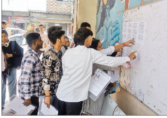
सोनीपत। मुखल अड्डा स्थित परीक्षा केंद्र पर सूरी में अपना रोल नंबर दूढ़ते विद्यार्थी।