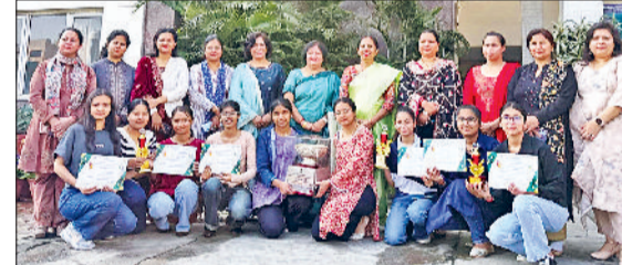
सोनीपत। विजेता छात्राओं के साथ प्राचार्या एवं अन्य।