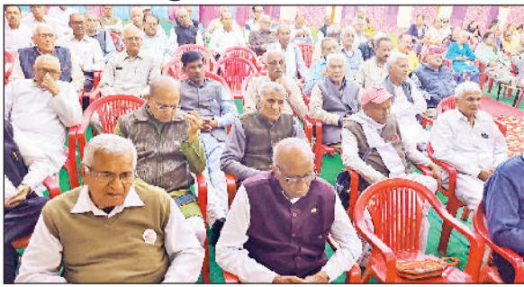
सोनीपत। कार्यक्रम के दौरान मौजूद गणमान्य लोग।

वैदिक यज्ञ समिति के 47वें वार्षिकोत्सव के तीसरे दिन प्रातःकालीन सभा में आचार्य वेदपाल ने यज्ञ और प्रकाश आध्यात्मिक महत्व पर प्रकाश डाला। उन्होंने कहा कि जो व्यक्ति ओदन रूपी यज्ञीय भावना को जीवन में धारण करता है और उसे आत्मसात करता है, वही स्वर्ग