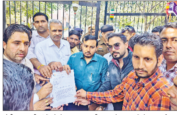
सोनीपत। अपनी मांगों को लेकर नायब तहसीलदार को ज्ञापन सौंपते हुए प्रदर्शनकारी कर्मचारी।

श्रम पोर्टल पुनः शुरू करने, बेनस और भत्तों में वृद्धि, पुरानी पेंशन योजना लागू करने सहित अनेक मांगों को प्रमुखता से उठाया। ज्ञापन में मांग की गई कि ईपीएस-95 के तहत न्यूनतम पेंशन को 1000 रुपये से बढ़ाकर 7500 रुपये प्रतिमाह किया जाए और इसे महंगाई भत्ते से जोड़ा जाए। ईपीएफ अंशदान हेतु वेतन सीमा 30,000 रुपये और ईएसआईसी कवरेंज सीमा 42,000 रुपये निर्धारित करने की मांग रखी गई। इसके अलावा स्कीम वर्कर्स और ठेका श्रमिकों को स्थायी करने तथा 4-5 वर्ष से अधिक सेवा वाले एचकेआरएन कर्मचारियों को सर्विस एक्ट 2024 का लाभ देने की मांग की गई। प्रदर्शनकारियों ने मिड-डे मिल वर्कर और आंगनबाड़ी कार्यकर्ताओं को सरकारी कर्मचारी का दर्जा देकर समान काम-समान वेतन लागू करने की मांग भी शामिल रही।