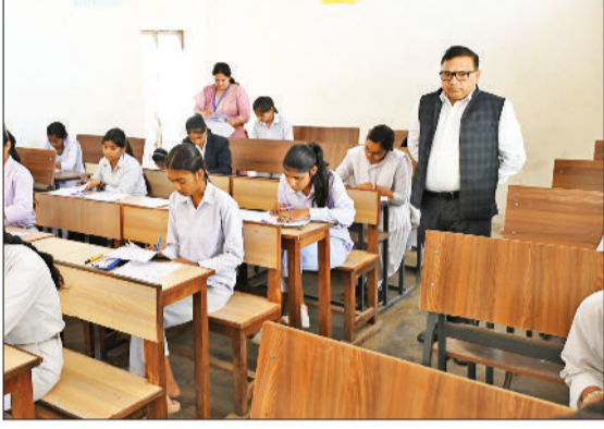
सोनीपत। गद्दी ब्राहमणान के परीक्षा केंद्र का निरीक्षण करते उपायुक्त।

वार्षिक परीक्षा दी थी। सोनीपत में कक्षा 10वीं व 12वीं के विद्यार्थियों के लिए 82 परीक्षा केंद्रों बनाए हैं। परीक्षा को लेकर केंद्रों पर सुरक्षा के कड़े प्रबंध किए गए हैं।