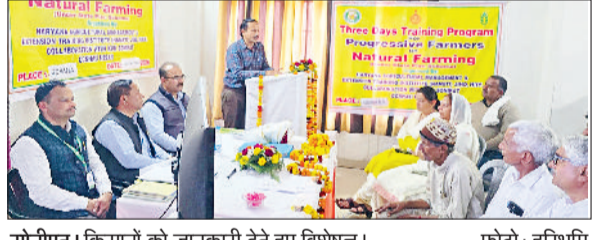
सोनीपत। किसानों को जानकारी देते हुए विशेषज्ञ।

भारतीय मजदूर संघ के आह्वान पर मंगलवार को सोनीपत में श्रमिकों की विभिन्न ज्वलंत मांगों को लेकर विशाल रोष प्रदर्शन आयोजित किया गया। इस प्रदर्शन में करीब पुरुष और महिला श्रमिकों ने भाग लेकर केंद्र व राज्य सरकार के खिलाफ अपनी आवाज बुलंद की। प्रदर्शनकारी कार्यकर्ताओं ने जिला उपायुक्त के माध्यम से प्रधानमंत्री, केंद्रीय श्रम मंत्री तथा हरियाणा के मुख्यमंत्री के नाम ज्ञापन सौंपते हुए श्रमिक हितों से जुड़े प्रस्तावों को शीघ्र लागू करने की मांग की। यह आंदोलन आडिशा के पुरी में आयोजित भारतीय मजदूर संघ के 21वें अखिल भारतीय त्रैवार्षिक अधिवेशन में पारित प्रस्तावों के समर्थन में किया गया। श्रमिकों ने न्यूनतम पेंशन और वेतन वृद्धि, सेवा सुरक्षा, समान काम-समान वेतन, श्रम पोर्टल पुनः शुरू करने, बेनस और भत्तों में वृद्धि, पुरानी पेंशन योजना लागू करने सहित अनेक मांगों को प्रमुखता से उठाया। ज्ञापन में मांग की गई कि ईपीएस-95 के तहत न्यूनतम पेंशन को 1000 रुपये से बढ़ाकर 7500 रुपये प्रतिमाह किया जाए और इसे महंगाई भत्ते से जोड़ा जाए। ईपीएफ अंशदान हेतु वेतन सीमा 30,000 रुपये और ईएसआईसी कवरेंज सीमा 42,000 रुपये निर्धारित करने की मांग रखी गई। इसके अलावा स्कीम वर्कर्स और ठेका श्रमिकों को स्थायी करने तथा 4-5 वर्ष से अधिक सेवा वाले एचकेआरएन कर्मचारियों को सर्विस एक्ट 2024 का लाभ देने की मांग की गई। प्रदर्शनकारियों ने मिड-डे मिल वर्कर और आंगनबाड़ी कार्यकर्ताओं को सरकारी कर्मचारी का दर्जा देकर समान काम-समान वेतन लागू करने की मांग भी शामिल रही।