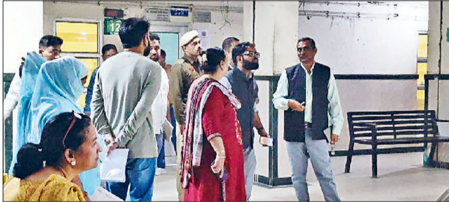
सोनीपत। नागरिक अस्पताल का निरीक्षण कर व्यवस्था का जायजा लेते अतिरिक्त उपायुक्त लक्षित सरिन।

अतिरिक्त उपायुक्त लक्षित सरिन ने बुधवार को दिल्ली रोड स्थित नागरिक अस्पताल में निरीक्षण कर स्वच्छता की अव्यवस्था पर सवाल उठाए। उन्होंने अस्पताल परिसर में चल रहे निर्माण कार्यों के साथ वहां स्वच्छता व्यवस्थाओं का जायजा लेकर नाराजगी जताई। उन्होंने निरीक्षण के दौरान अस्पताल परिसर में चल रहे निर्माण कार्यों की समीक्षा की। साथ ही सिविल सर्जन व लोक निर्माण विभाग के अधिकारियों को कार्य में तेजी लाने के निर्देश दिए। लक्षित सरिन ने सिविल सर्जन को निर्देश दिए कि अस्पताल परिसर की स्वच्छता व सुरक्षा मानकों का पूरा ध्यान रखा जाए। नए भवन निर्माण कार्य का निरीक्षण कर उन्होंने संबंधित अधिकारियों के साथ वर्तमान स्थिति पर चर्चा की। एडीसी ने कहा कि निर्माण कार्यों में तेजी लाई जाए, सुरक्षा मानकों का सख्ती से पालन किया जाए।