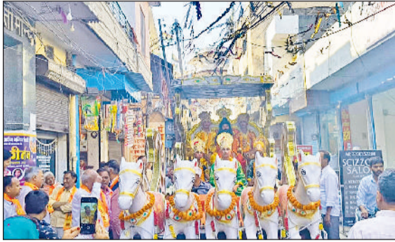
सोनीपत। बड़ा बाजार स्थित पंचायती ठाकुर द्वारा मंदिर से निकाली गई श्रीराम बारात में शामिल श्रीराम, लक्ष्मण, भरत, शत्रुघ्न की झांकी।

हलवाई हट्टा स्थित श्रीदेवी चिट्टाने वाली माता मंदिर सिद्धपीठ में चल रहे वार्षिक उत्सव श्री रामकथा एवं नवचंडी महायज्ञ का पांचवां दिन रहा। बड़ा बाजार स्थित पंचायती ठाकुर द्वारा मंदिर से बुधवार को बैंड बाजों के साथ श्रीराम की बारात निकाल विवाहोत्सव मनाया गया। मंदिर समिति के पदाधिकारियों ने गणेश पूजन के पश्चात श्रीराम बारात का शुभारंभ किया। राम बारात में भगवान गणेश, राम दरबार, महाराजा दशरथ के साथ राम, लक्ष्मण, भरत, शत्रुघ्न व मां दुर्गा की झांकियां आकर्षक का केंद्र रहीं। बैंड-बाजों ने धार्मिक धुनों से शहर में भक्तिमय माहौल बनाया। बारात के दौरान मंदिर पर श्रद्धालुओं ने खूब नृत्य किया। इससे श्रद्धालु व पांडव नगरी धर्ममय हो उठी। इससे पहले सुबह नवचंडी परिसर में मंत्रोच्चारण के साथ नवचंडी महायज्ञ किया गया। श्रीराम बारात पंचायती ठाकुर द्वारा मंदिर से प्रारंभ होकर शहर के