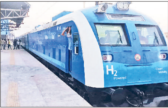
सोनीपत। मोहाना स्टेशन पर ट्रायल के दौरान खड़ी हाइड्रोजन ट्रेन।

देश की पहली हाइड्रोजन ट्रेन के जींद-सोनीपत रूट पर जल्द फराटा भरने के कयास लगाए जा रहे हैं। बुधवार को जींद से सोनीपत के मोहाना स्टेशन तक अपडाउन रूट पर 6 फेरे लगाकर 70 किलोमीटर प्रतिघंटा की रफ्तार से हाइड्रोजन ट्रेन का ट्रायल लिया गया। हालांकि दिनभर हाइड्रोजन ट्रेन के सोनीपत स्टेशन तक ट्रायल लिए जाने की चर्चाओं का माहौल बना रहा। ऐसे में रेल यात्री भी हाइड्रोजन ट्रेन को एक नजर देखने के लिए उत्साहित थे, लेकिन शाम 5:30 बजे मोहाना स्टेशन से वापस ट्रेन को जींद की तरफ रवाना कर दिया गया। ट्रायल के दौरान हाइड्रोजन ट्रेन की गति, सिग्नल व ब्रेकिंग सिस्टम, ईंधन