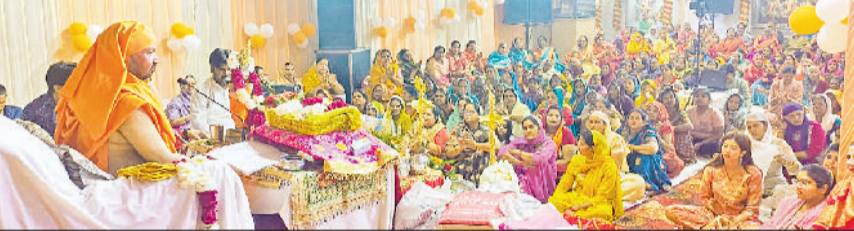
सोनीपत। हलवाई हट्टा स्थित श्रीदेवी चिट्टाने वाली माता मंदिर सिद्धपीठ में कथा सुनाते कथाव्यास व श्रवण करते श्रद्धालु।