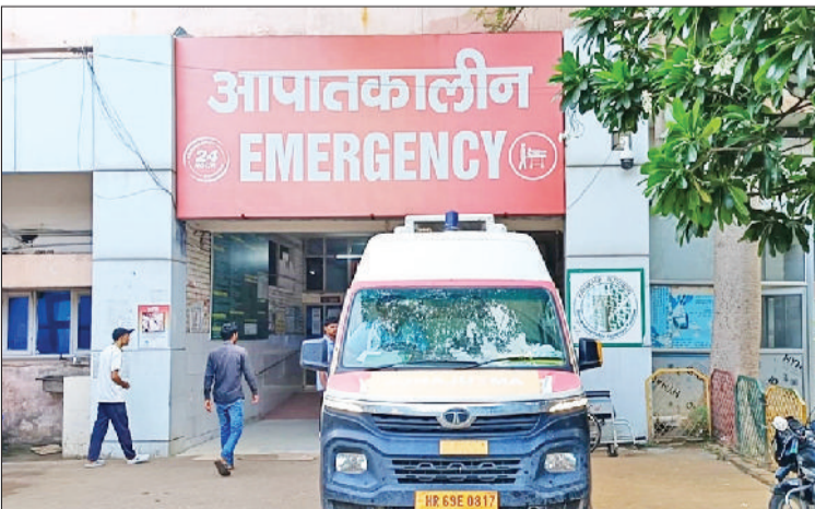
सोनीपत। दिल्ली रोड स्थित जिला नागरिक अस्पताल।